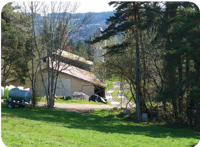
« Ici, nous avons des clairières de terres agricoles au milieu des bois. »

« On sent qu'il y a quelque chose qui peut fonctionner, s'exclame-t-il. Il suffit de regarder : nous sommes une zone peu productive au milieu d'une région qui a de gros besoins en produits locaux. Et en plus, nous élevons des porcs de plus en plus lourds, dont la viande plus mûre qu'avant est de meilleure qualité. La montagne, ça sonne bien pour les consommateurs. »